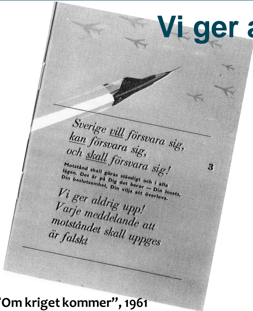
”Om kriget kommer”, 1961

Om Sverige blir angripet av ett annat land kommer vi aldrig att ge upp. Alla uppgifter om att motståndet ska upphöra är falska.